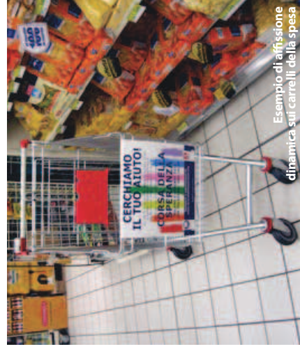
Esempio di affissione dinamica sui carrelli della spesa

D omenica 9 ottobre vedrà l'edizione 2011 della "Corsa della Speranza", marcia di solidarietà patrocinata da Comune di Milano, Provincia di Milano e Regione Lombardia e promossa dall'Associazione Corriere per la Speranza, sostenuta da Eso - European School of Oncology, Ffo - Fondazione per la Formazione Oncologica e Four Seasons Hotel Milano. Quest'anno gli interi pro-